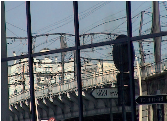
Reflet TGV saisie vidéo, 2011, C.Crozat - P.Thomé.

Caroline Joubert (extrait de Et à partir de là , édition Fage, 2010)