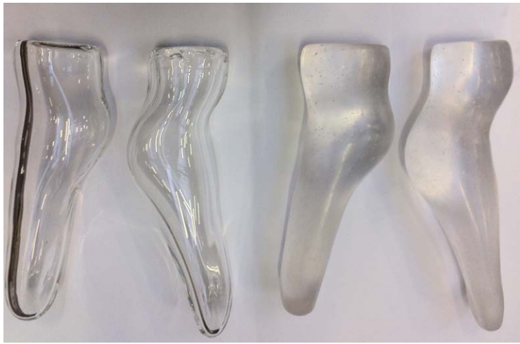
Gisant en chaussette , 2011, verre soufflé, pâte de verre, atelier Glassworks, Bâle (CH)