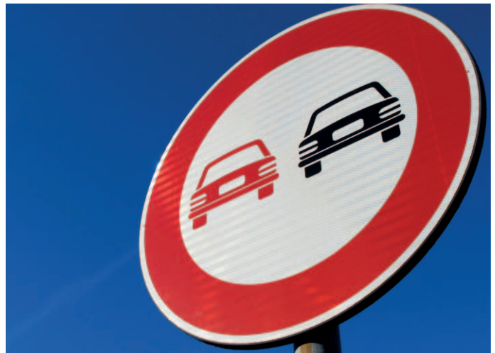
Lido , Pellestrina, 2011. 40 x 30 cm.